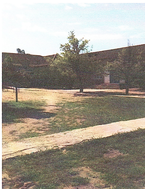
Рис.1 Фото «До»